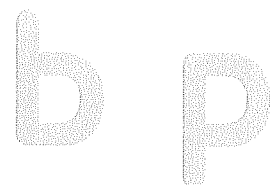
K. Kunnen AA